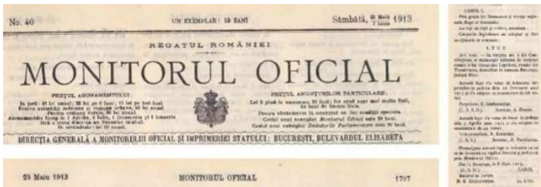
Figure 5. Alexandru obține cetățenia română pe 25 mai/7 iunie 1913