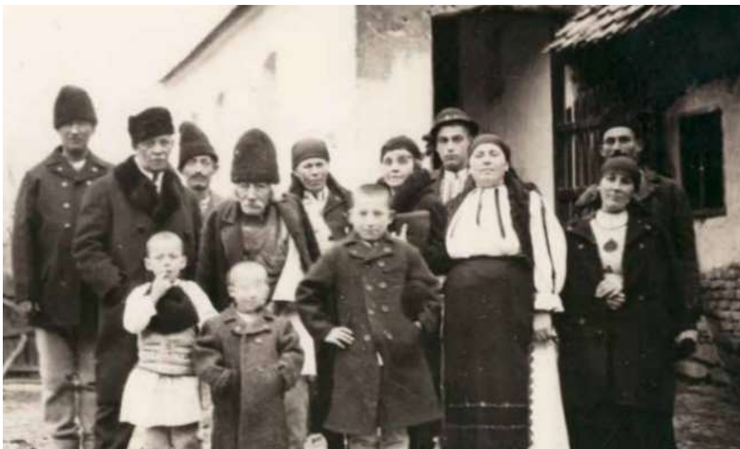
Figura 1. Familia Lapedatu la Glâmboaca