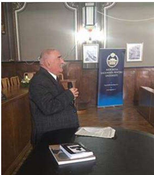
Figura 21. Conferința Profesorului univ. Ioan Oprea, liderul cercetării istorice legate de frații Lapedatu, în sala de festivități a Colegiului Național „Andrei Șaguna” pe 18 noiembrie 2016