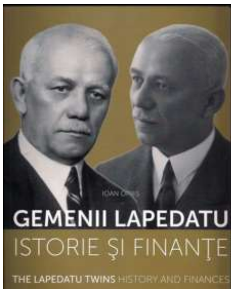
Figure 20. Albumul „Gemenii Lapedatu. Istorie și finanțe”, Editura „Oscar Print” (ISBN 978-973-668-435-7)