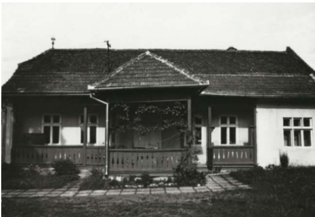
Figure 2. Casa natală din Cernatu, comuna Săcele, lângă Braşov