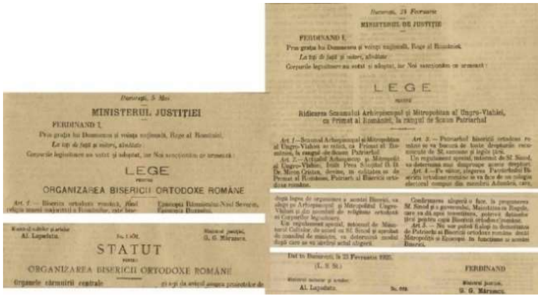
Figura 7. Legile asupra organizării Bisericii ortodoxe și înființării Patriarhiei semnate de Alexandru I. Lapedatu