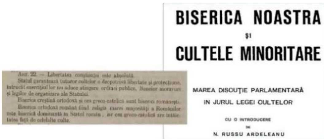
Figura 9. Articolul 22 al Constituției din 1923 și coperta volumului asupra mării discuții parlamentare în jurul legii cultelor