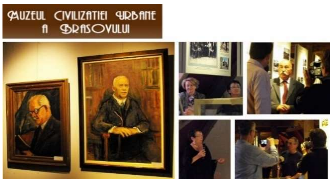
Figura 19. Expoziția „Personalități brașovene în elita românească. Frații Alexandru și Ion Lapedatu la a 140-a aniversare”, Muzeul Civilizației Urbane a Brașovului, 30 septembrie 2016