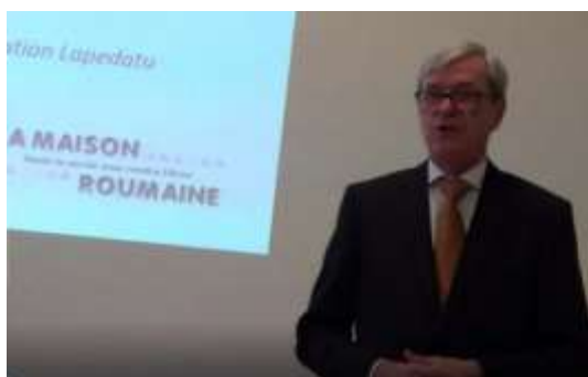
Figura 22. Conferința Fundației Lapedatu, La Maison Roumaine, Paris, pe 8 octombrie 2016.