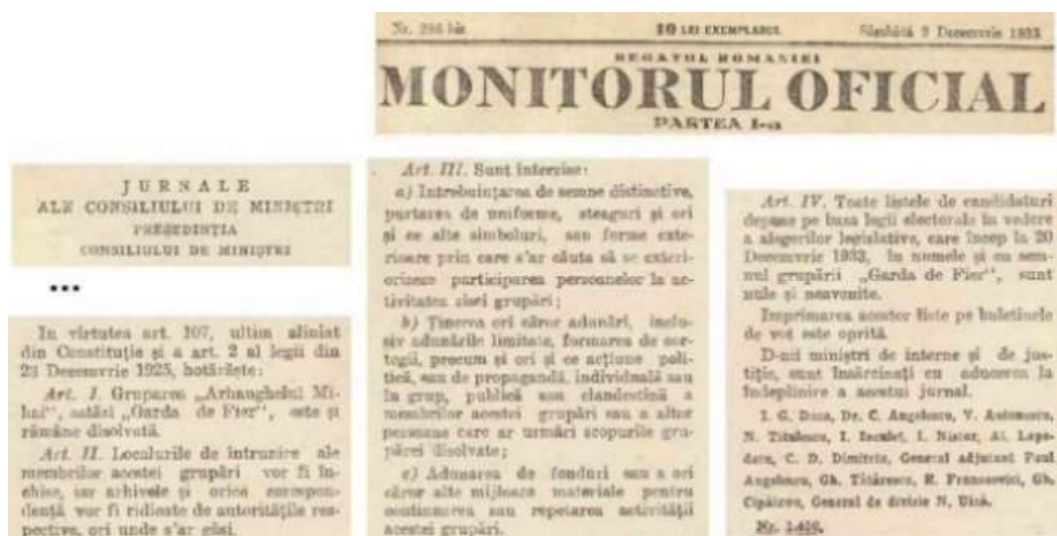
Figura 13. Decretul care scoate în afara legii „Garda de Fier”, co-semnat de Alexandru I. Lapedatu