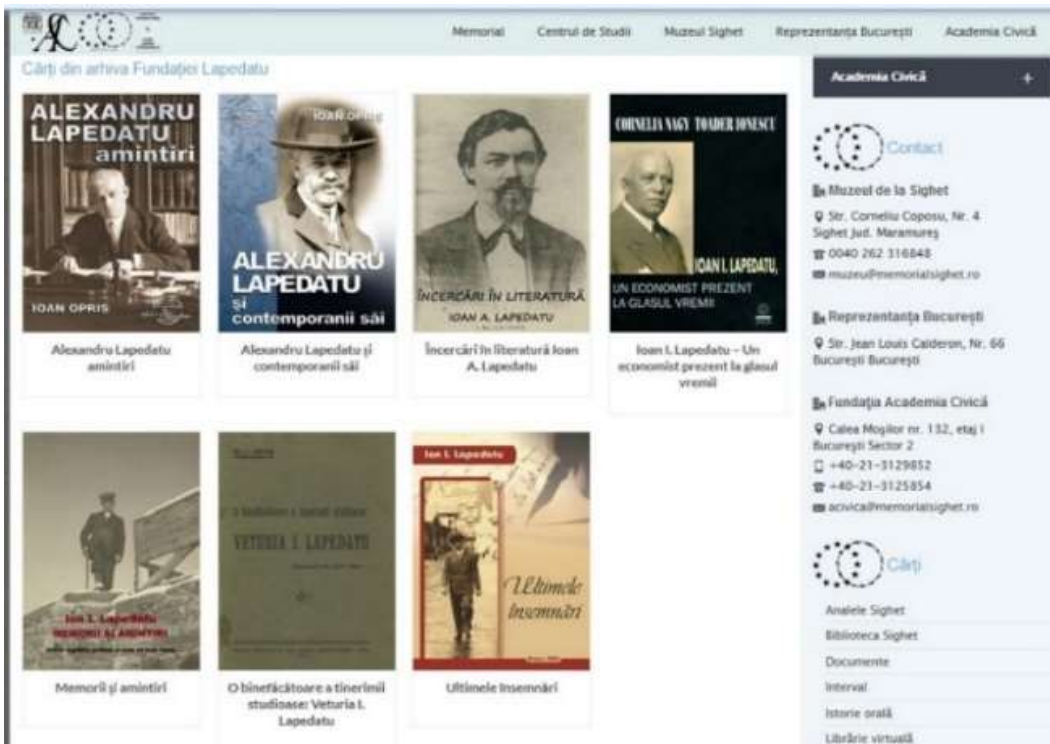
Figura 15. Publicații de și despre frații Lapedatu în Biblioteca virtuală a Memorialului victimelor comunismului și ale rezistenței, Fundația Academia Civică