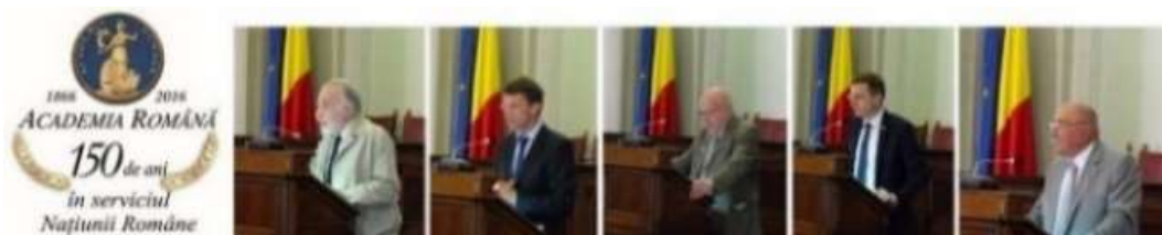
Figura 17. Sesiunea comemorativă de comunicări a Academiei Române din 12 septembrie 2016 dedicată fraților Lapedatu