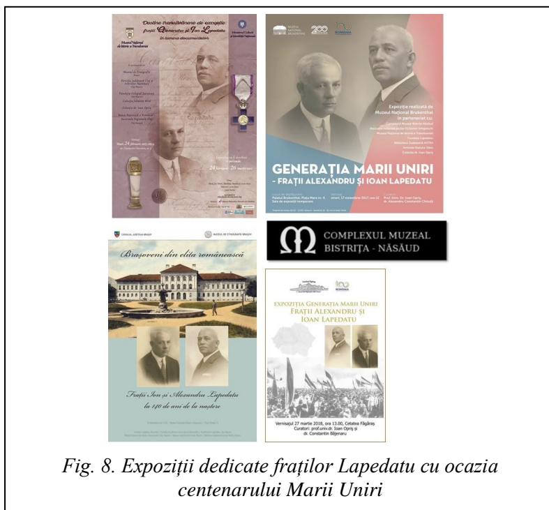
Fig. 8. Expoziții dedicate fraților Lapedatu cu ocazia centenarului Marii Uniri

În contextul centenarului primului război mondial și al Marii Uniri, manifestările menționează personalitățile epocii (fig. 8):