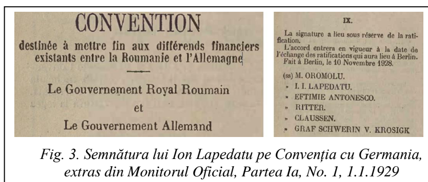
Fig. 3. Semnătura lui Ion Lapedatu pe Convenția cu Germania, extras din Monitorul Oficial, Partea Ia, No. 1, 1.1.1929

Împrumutul de stabilizare subscris de bănci britanice, americane și franceze este legiferat la 7 martie 1929, cu puține luni înainte de crahul din 24 octombrie 1929 care va declanșa o teribilă criză în întreaga lume. În decembrie, Ion se duce la Amsterdam unde încheie un acord de principiu asupra posibilității