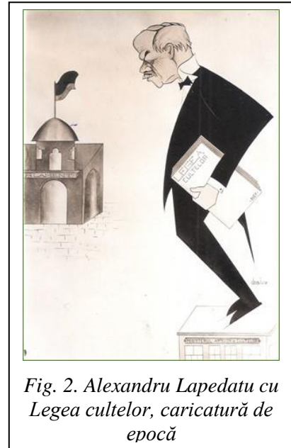
Fig. 2. Alexandru Lapadatu cu Legea cultelor, caricatură de epocă

Mulțumită acestui progres, Alexandru este în măsură să propună în 1928 un nou proiect de lege pentru regimul general al cultelor. Dezbaterile parlamentare, foarte animate, durează trei săptămâni. Toată țara ia parte: se organizează adunări de susținere sau de protest, demonstrații, rugăciuni publice, procesiuni... Dar textul final este votat aproape în unanimitate și este promulgat la 22 aprilie 192 (fig. 2). Această lege va asigura relații bazate pe normalitate între culte, ca și între culte și stat.