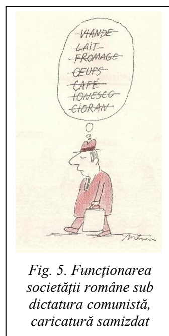
Fig. 5. Funcționarea societății române sub dictatura comunistă, caricatură samizdat

Cu excepția unor perioade de redresare scurte și puține la număr, lucrurile merg din ce în ce mai rău. Economia funcționează prost sau aproape de loc. Statul decide prim mijloace „științifice” care este numărul de calorii zilnice pe cap de român, câte ore pe zi se va distribui electricitate pentru a satisface nevoile românilor, ce publicații au voie românii să citească. Penuria este cotidiană, atât materială cât și spirituală. Un caricaturist sintetizează cu umor negru situația într-o publicație „samizdat”: nu există carne, lapte, brânză, ouă, cafea, Ionescu, Cioran... 12 (fig. 5).